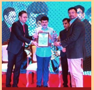
College Received Award from Education Minister Uday Samant